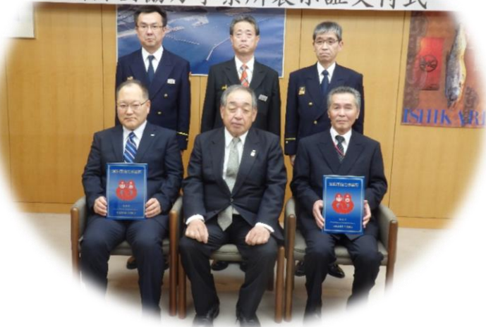
総務省消防庁 消防団協力事業所表示証交付式

このたび平成29年3月から、 厚田産業株式会社様 株式会社沢田建設工業様 の2事業所が新たに認定され、石狩市内において、これで4事業所が認定事業所となりました。