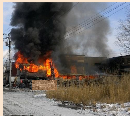
写真：昨年発生した火災の様子。