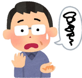
突然呂律が回らなくなる