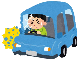
交通事故による大怪我