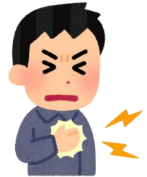
締め付けられるような胸痛