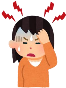
突然の激しい頭痛